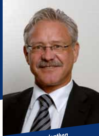
Beat Vonlanthen Staatsrat

Liebe Hauseigentümerinnen und Hauseigentümer